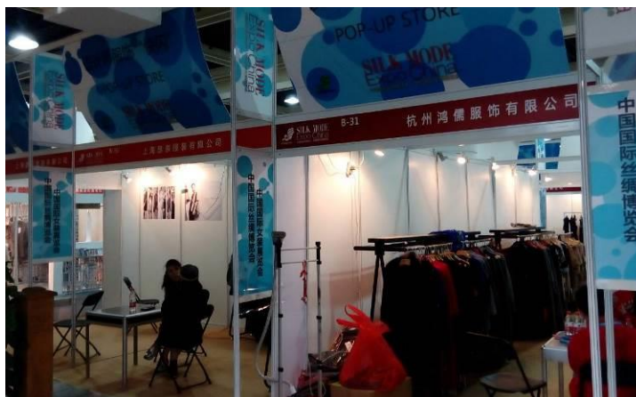
設計師品牌“pop-up”快閃 專區