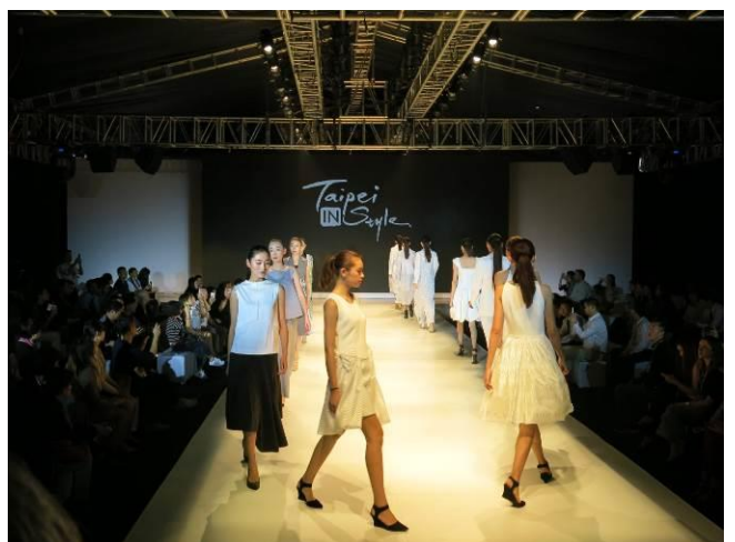
「台北魅力時尚匯演」謝幕