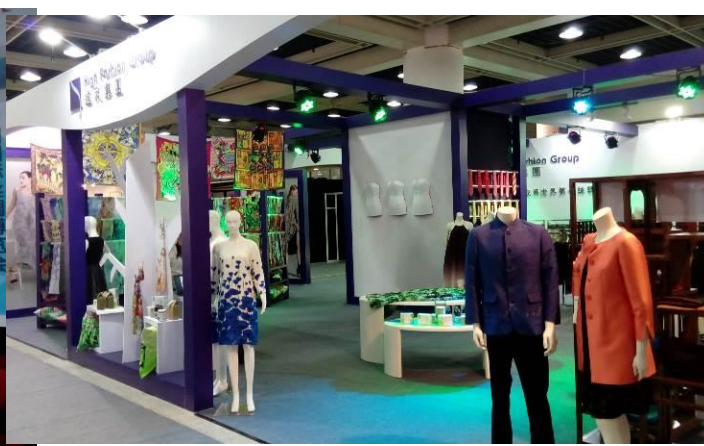
中國品牌 達利集團攤位