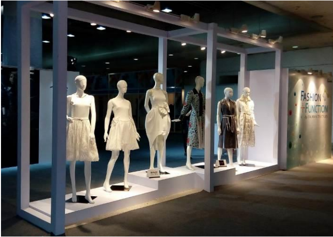
「台北魅力聯合推廣專區」一隅