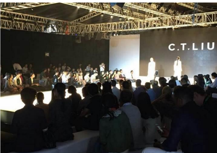
「台北魅力時尚匯演」人潮