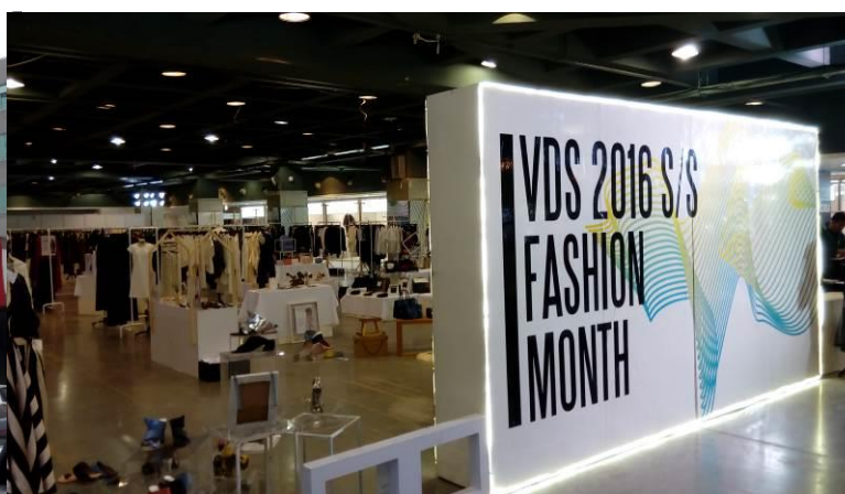
設計師品牌 SHOWROOM 專區